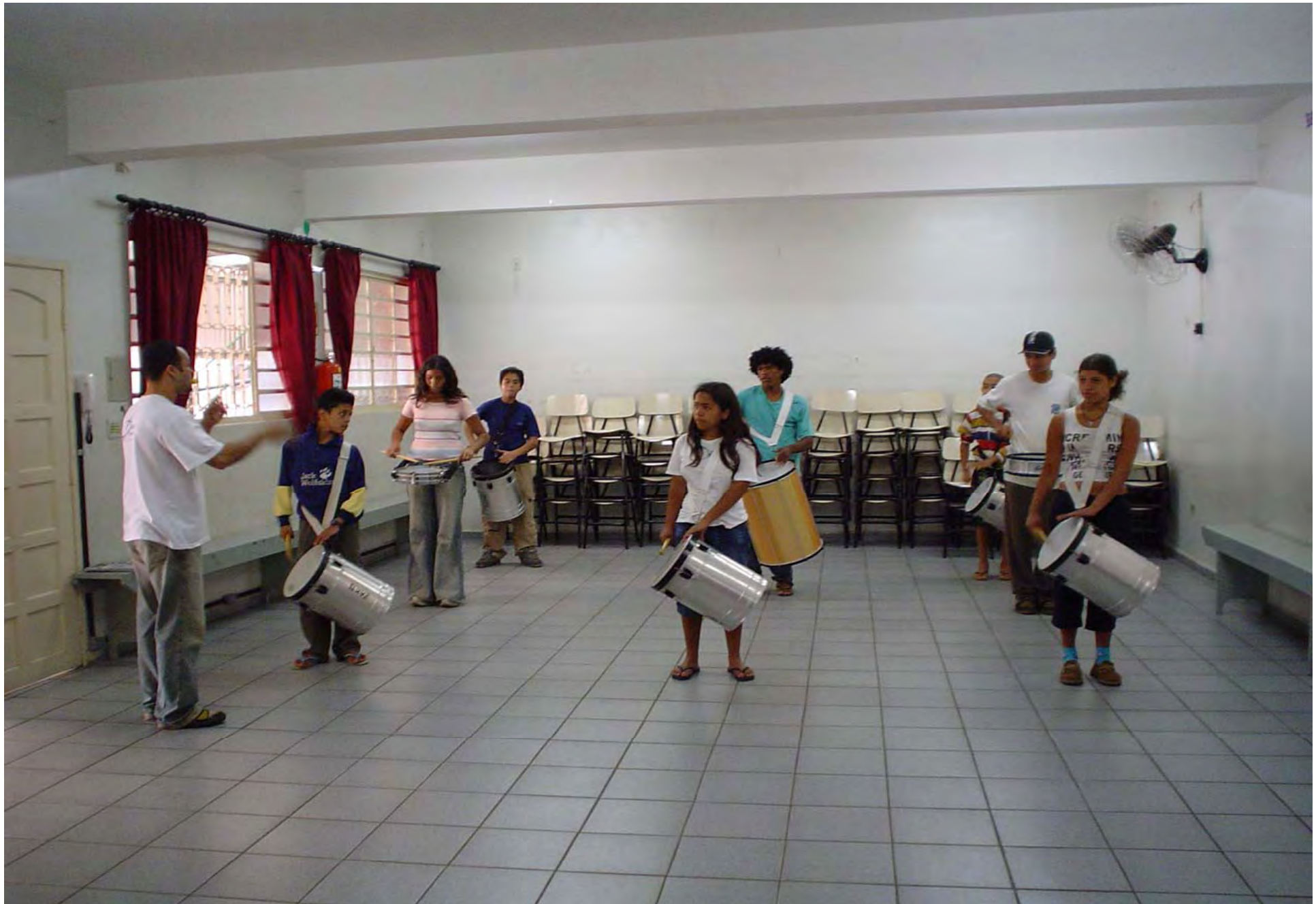
Aula di Percussione