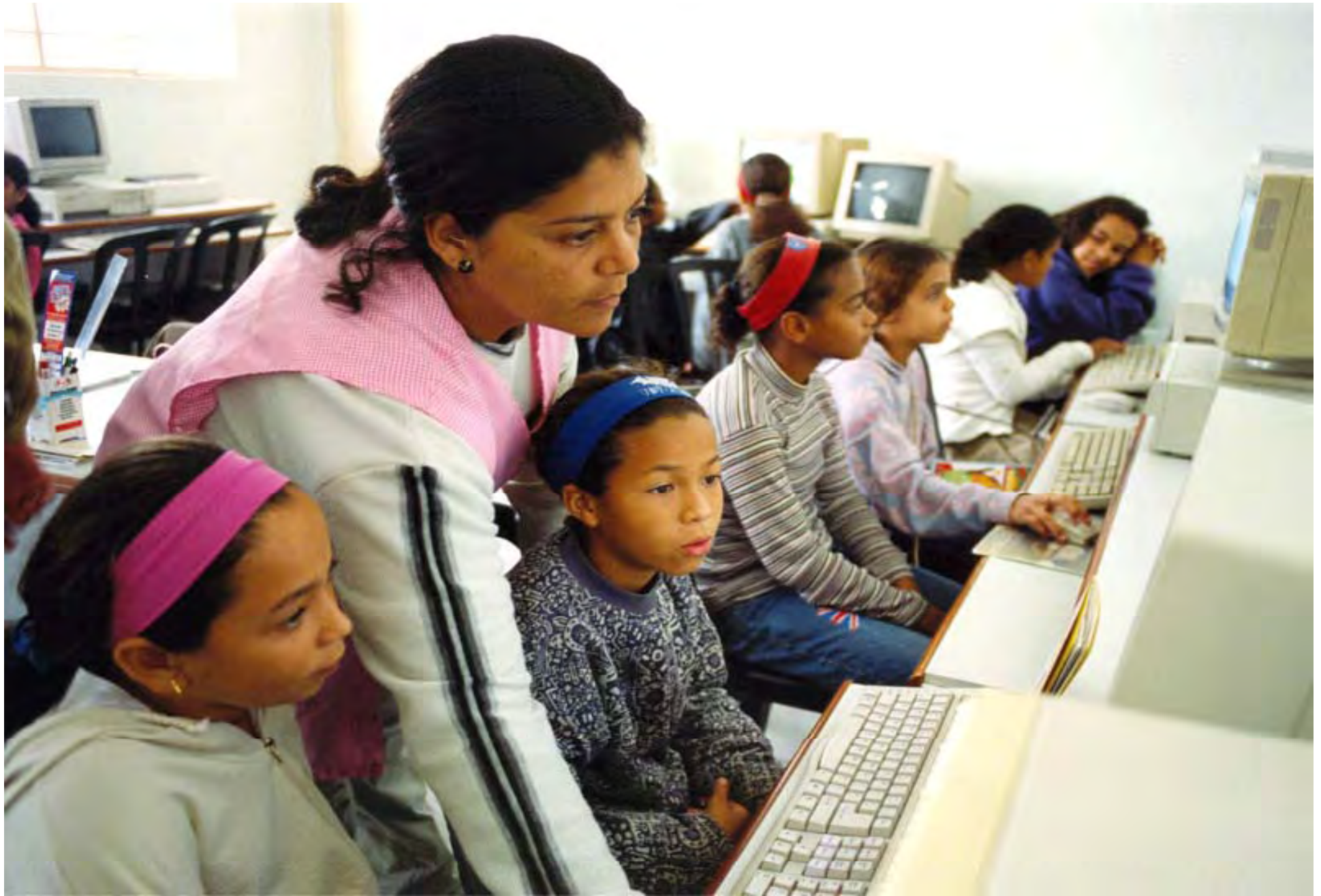
Aula di Informatica