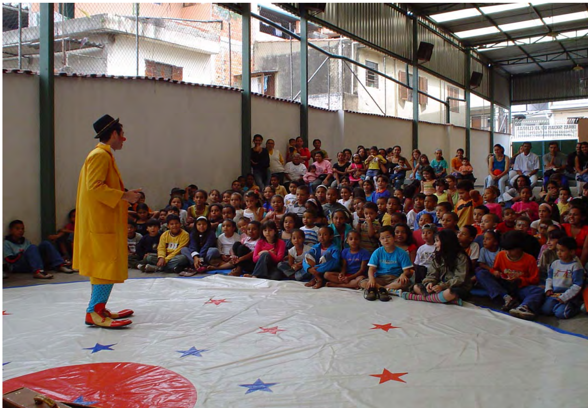
Il Circo visita i bambini