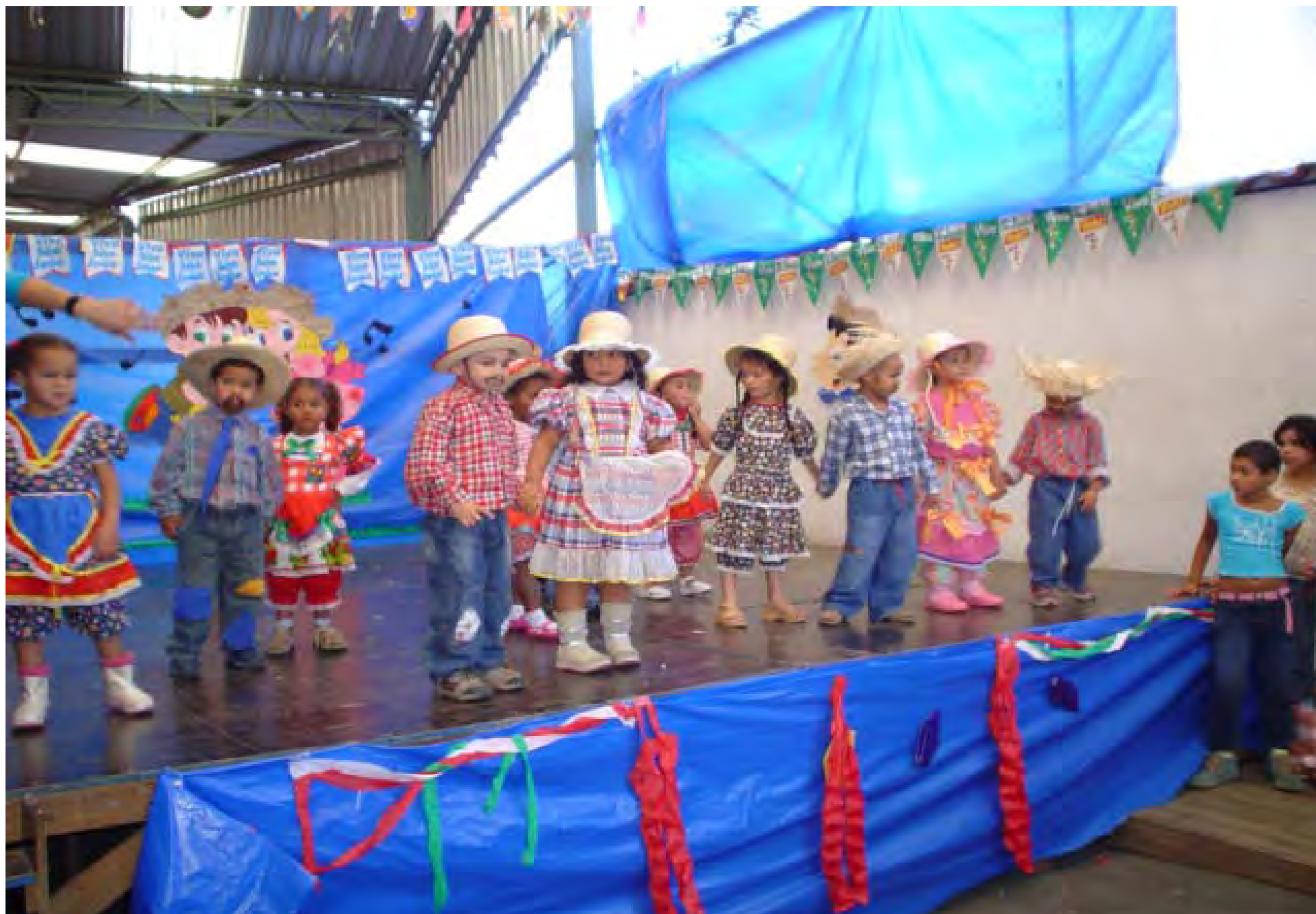
Festa Junina - Folclore