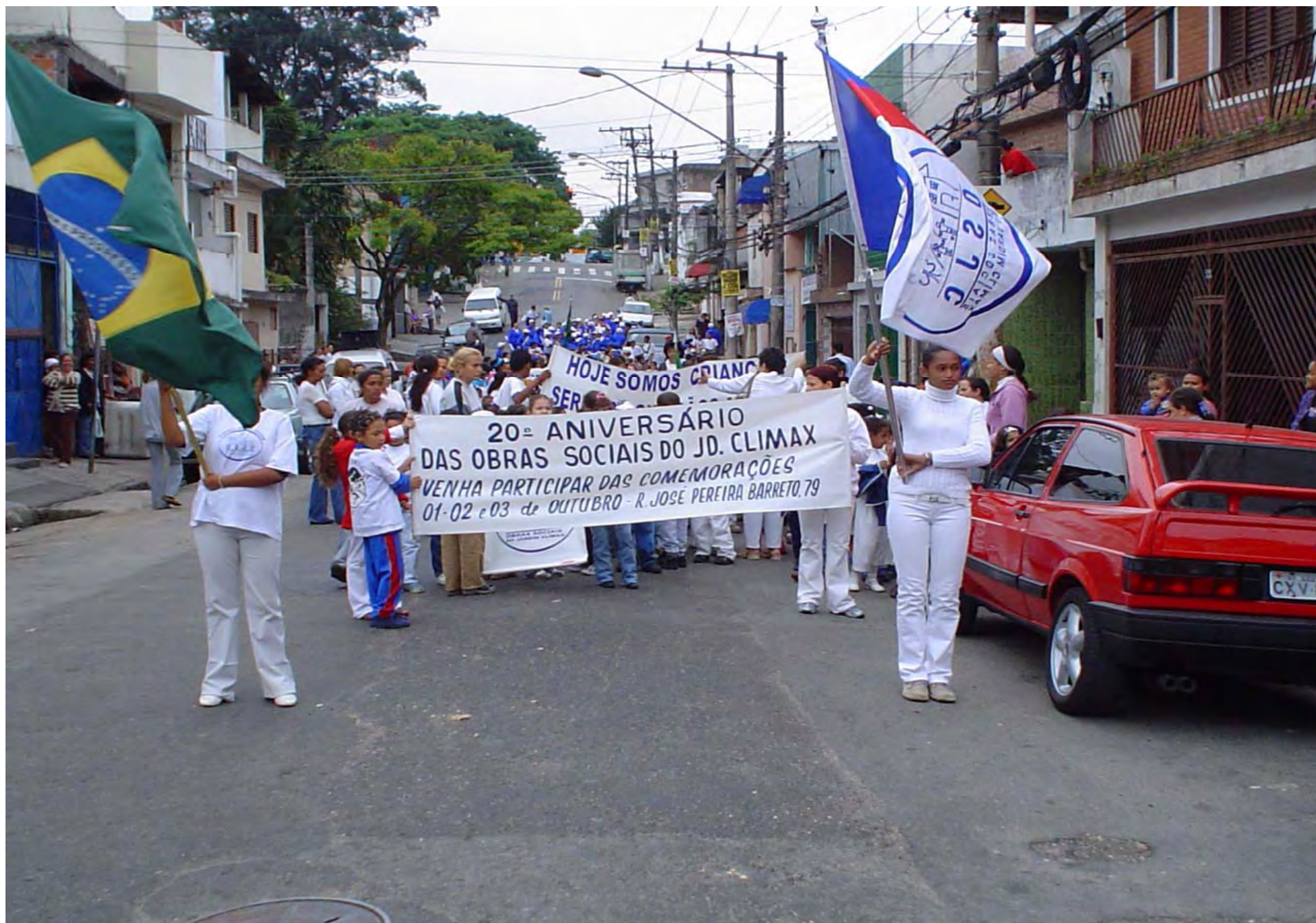
Camminata per la Pace - 01 / Ottobre / 2004