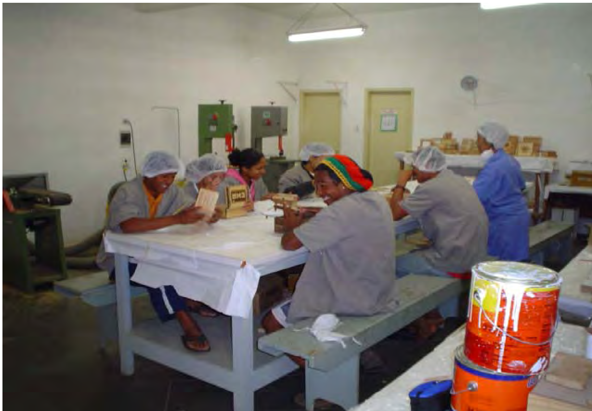
Aula dell'intarsio Ecologico