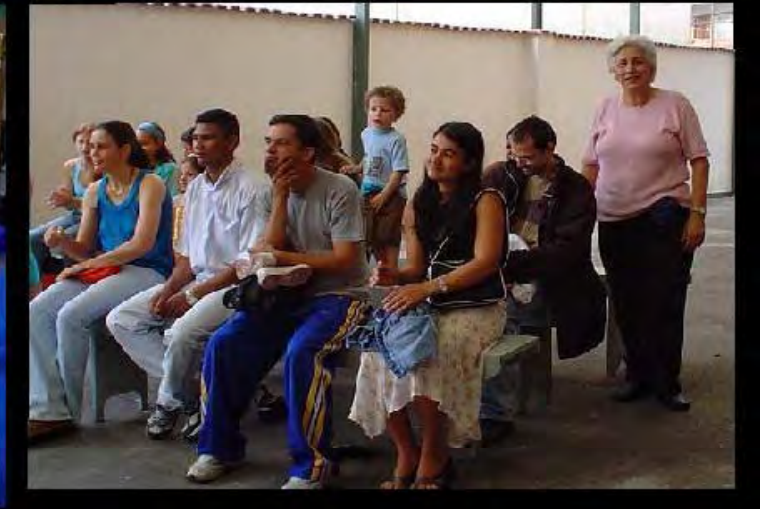
20 Anni - Celebrazione di Ringraziamento