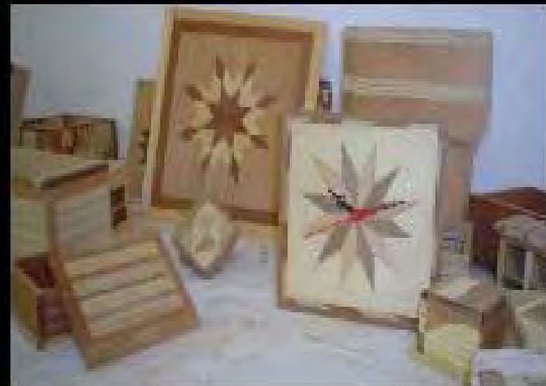
L' arte dell'Intarsio Ecologico, alcuni prodotti