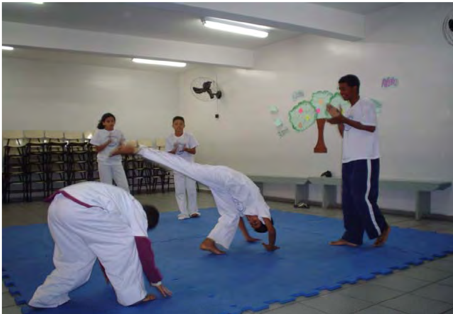
Aula di Capoeira, danza tipica brasiliana